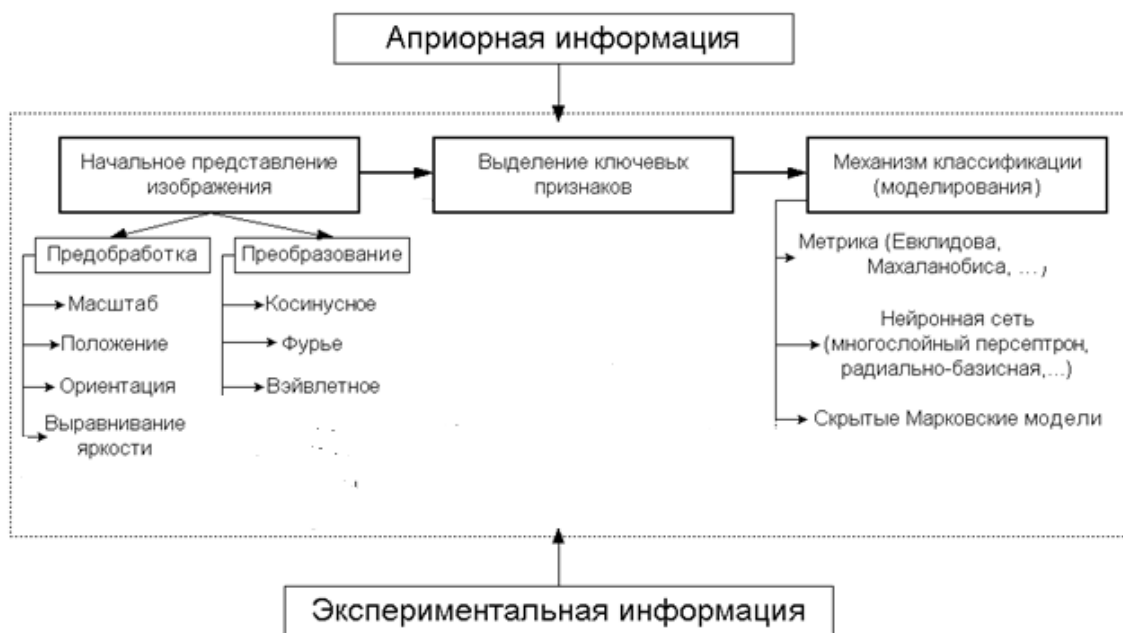
Рис. 3. Процедура обучения

Группа программ, объединенных в ПО обработки спектральнональных изображений включает в себя