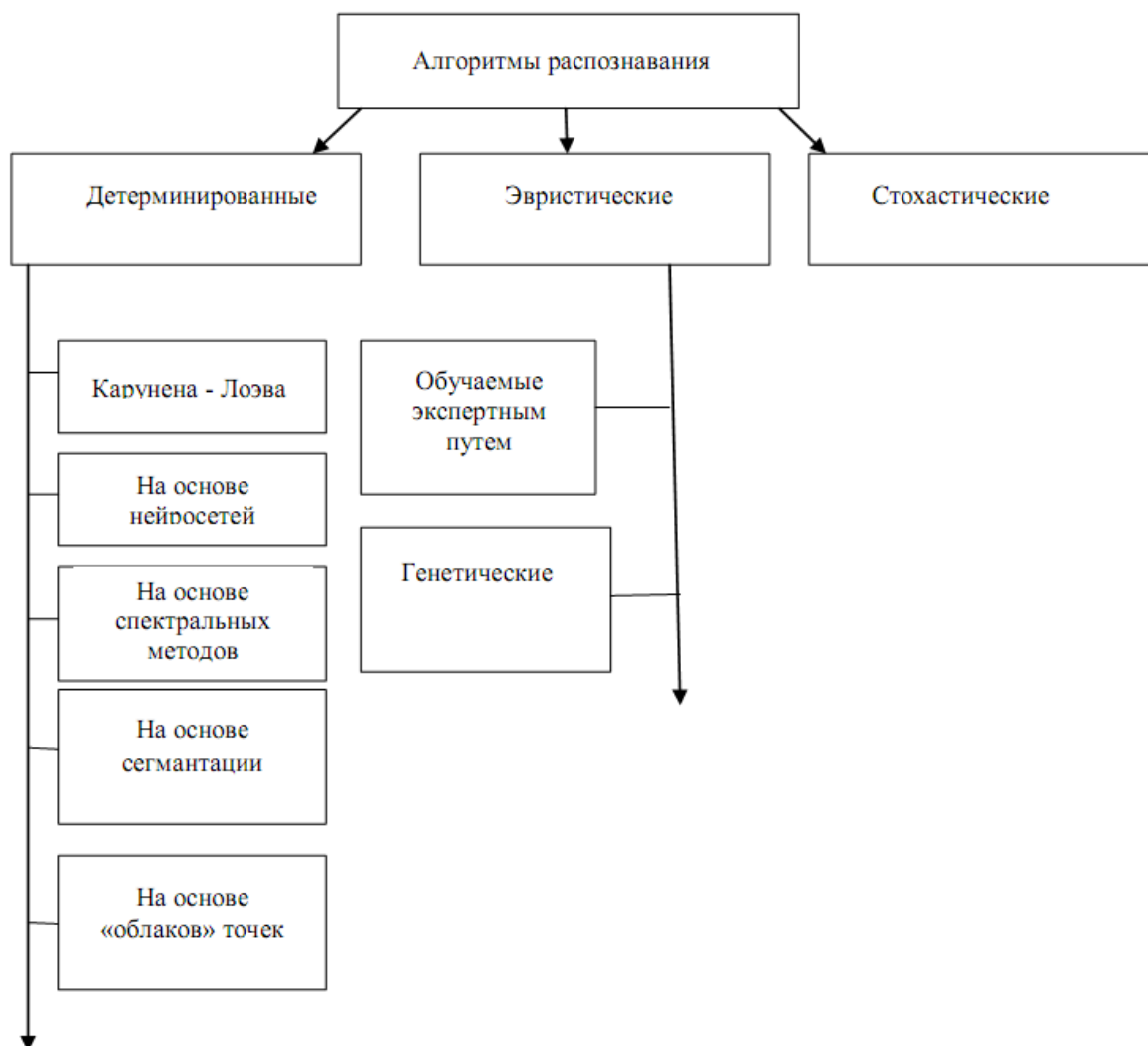
Рис. 2. Структура открытой библиотеки алгоритмов распознавания

Структура базового комплекта приведена на рис. 2.